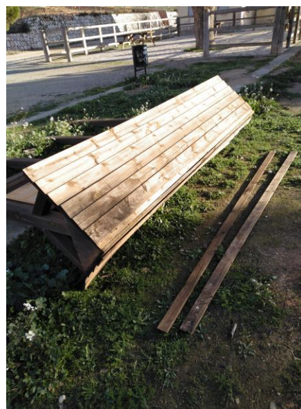
Imatges de l'estructura informativa caiguda.