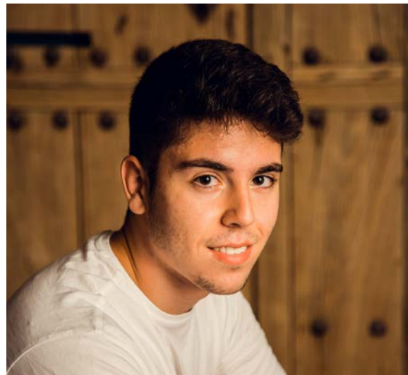
HEREU 2021 SERGI FORNÓS ZAPATER Associació l'Aldea Comercial