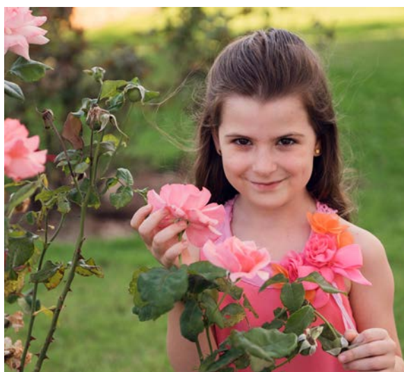
PUBILLETA 2020 MAR PORRES CENTELLES