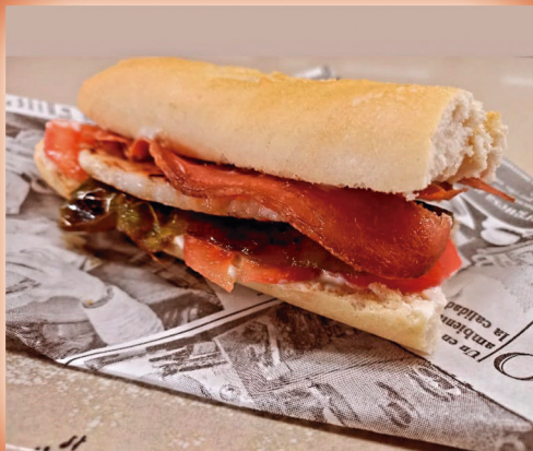
Serranito prèmium en solomillo .