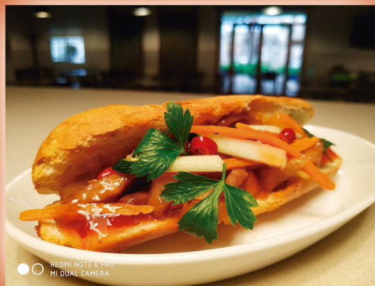
Banh MI Mini Baguet amb paté, carn rostida i verdures adobades.