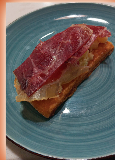
Pasta fullada en maçana i cecina.