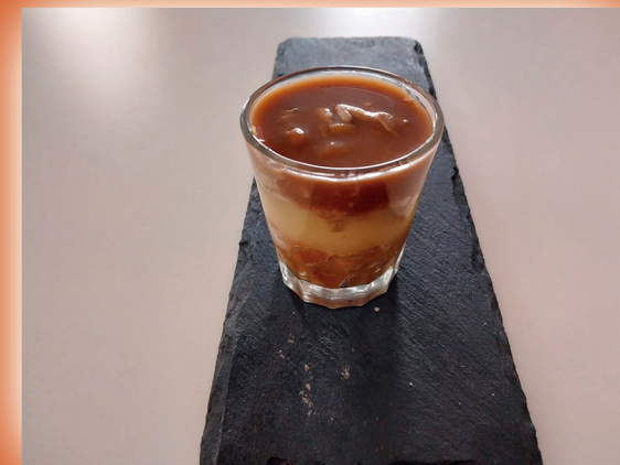
Melós de porc, ceba confitada i puré de maçana.