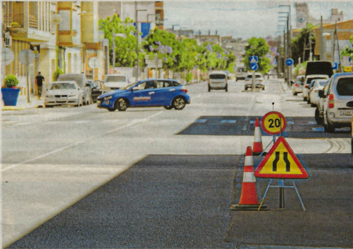
Els treballs a l'avinguda Catalunya s'allargaran fins a final d'any.

«Amb aquesta remodelació continuem canviant, millorant i transformant la imatge del nostre poble. Apostem per una pacificació del trànsit, donant un protagonisme especial a les bicicletes, els patinets, les persones i els vianants. Al mateix temps, continuem creant espais més agra-