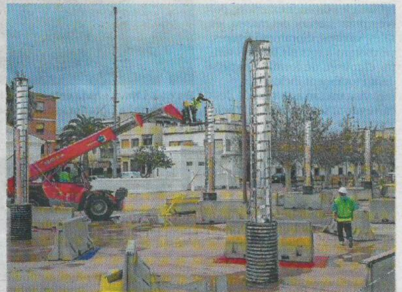
L'espai també permetrà fer actes i activitats culturals.

«Aquesta zona d'ombreig complementa la primera intervenció que ja es va dur a terme amb l'espai cultural obert. Representa una millora per al municipi, ja que oferirà un espai enfront de l'antiga estació del tren que podrà acollir tota mena d'activitats culturals, lúdiques i festives, com festivals, cinema a la fresca i altres esdeveniments», ha valorat l'alcalde de l'Aldea Xavier Royo.