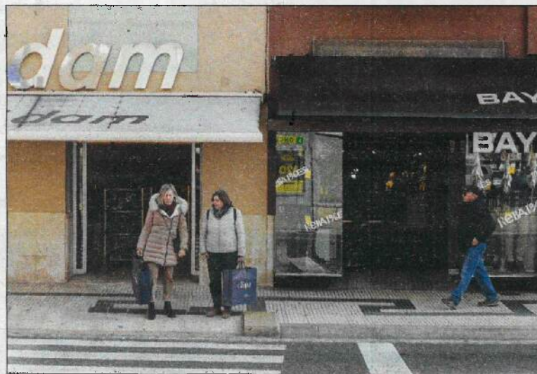
Dos comerços actius ubicats a l'avinguda de la Generalitat.

L'Ajuntament de Tortosa ha mantingut els Bons Tortosa, una iniciativa per afavorir les vendes en el comerç local. En el pressupost municipal d'enguany la partida assignada és de 200.000 euros. ■