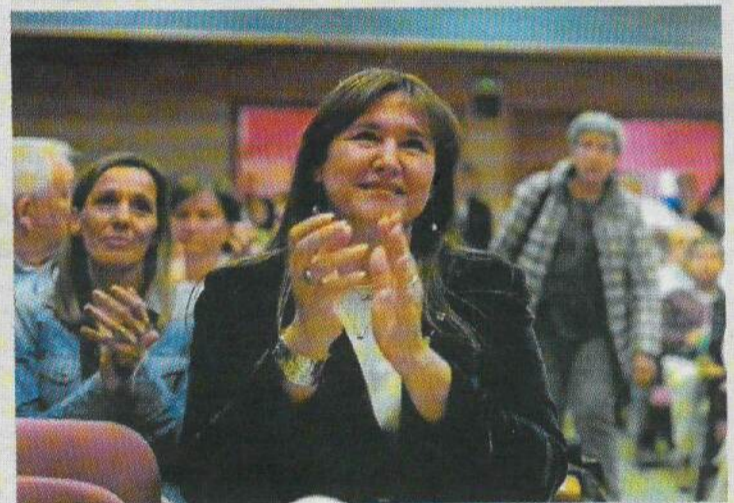
L'expresidenta de Junts Laura Borràs.

L'Ajuntament de l'Aldea ha completat la segona fase de l'enderrocament de les granges del Trinquet, situades a la urbanització Hostasol, avançant així en el seu compromís de transformar aquest espai en un entorn més agradable i funcional. Aquest projecte, iniciat amb l'objectiu d'eliminar edificacions en desús i obsoletes, ja ha permès l'enderroc de dues de les quatre granges existents. La segona fase, finalitzada el passat mes de desembre, ha tingut un cost total de 23.749,94 euros. «Aquest nou enderroc ens permet eliminar edificis obsolets i sense cap servei, alhora que contribueix a millorar la imatge visual de la urbanització Hostasol i a crear un entorn més atractiu i segur per als seus residents», remarca l'alcalde, Xavier Royo. Durant aquest any 2025 es durà a terme la tercera fase d'enderrocament, centrada en una altra de les granges.