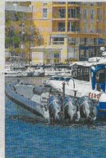
La narcollanxa al port de L'Ametlla.