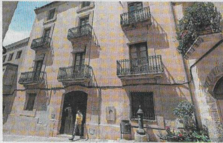
La gestió de l'alberg municipal Ca la Jepa ja s'ha tret a licitació diversos cops els darrers anys.

L'Ajuntament hi està construint un habitatge independent per a la família que se'n faci càrrec. L'escola, però, ara no corre perill