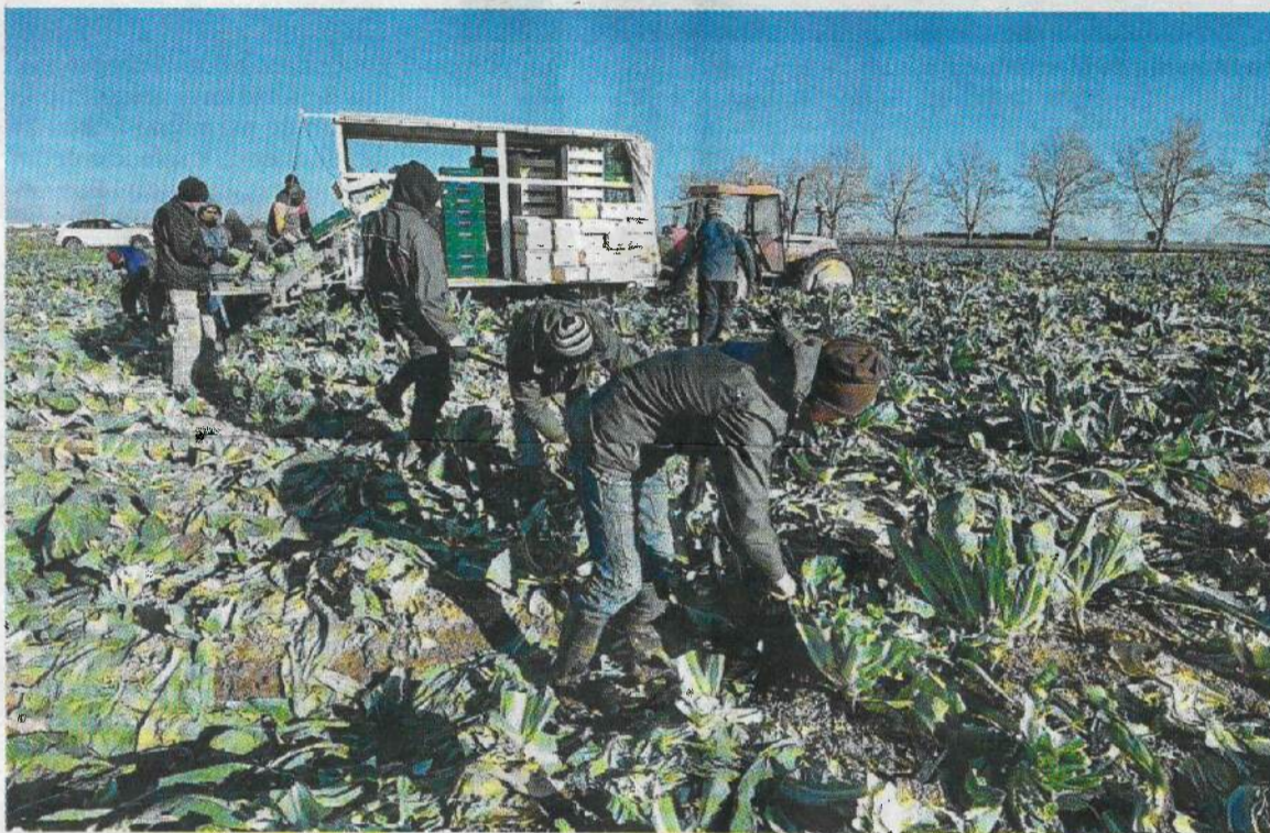
Treballadors del sector agrícola recollint verdura.

Tenint en compte aquestes variables, la comarca ebrenca a un nivell més baix és el Montsià. Segons explica al Diari el director de la Càtedra d'Economia Local i Regional de les Terres de l'Ebre,