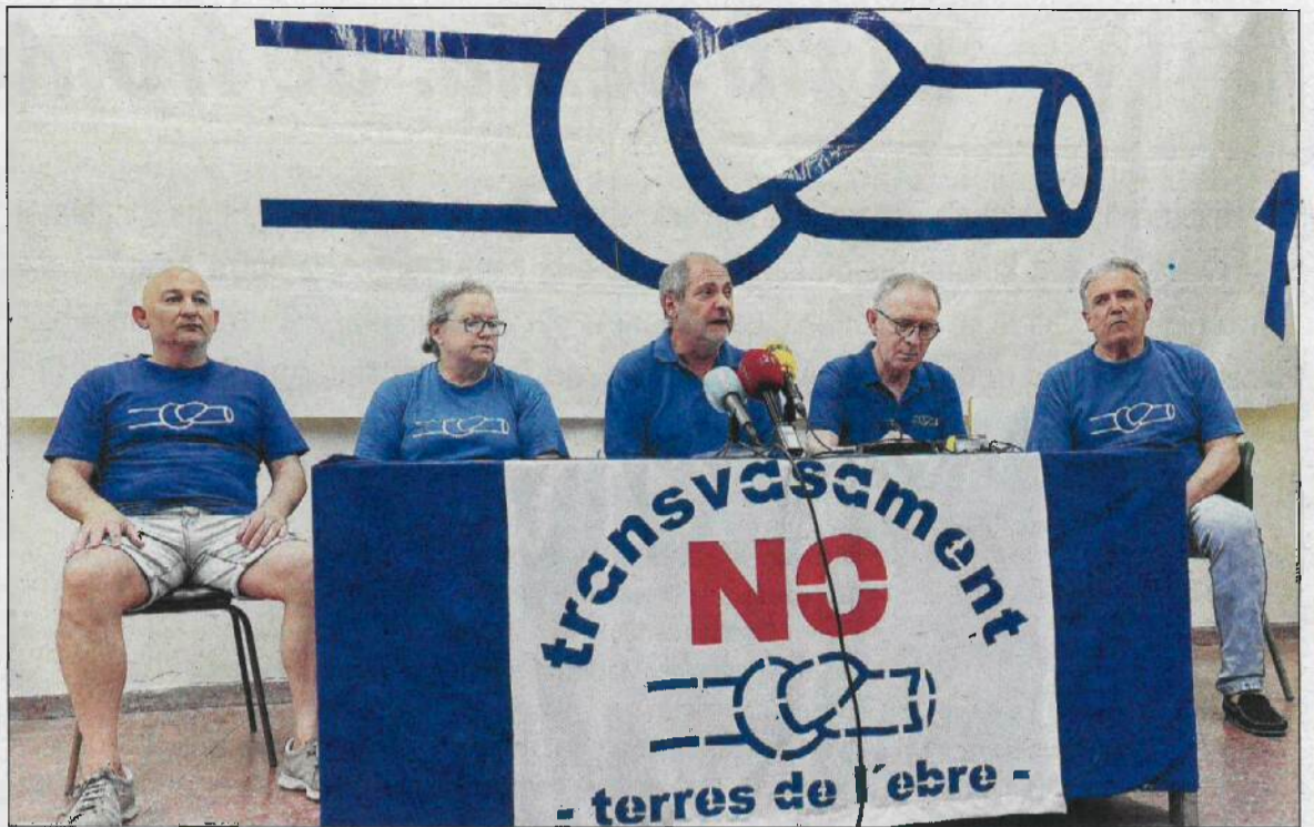
Els portaveus de la PDE, durant la roda de premsa en què han anunciat les protestes a l'Ampolla.