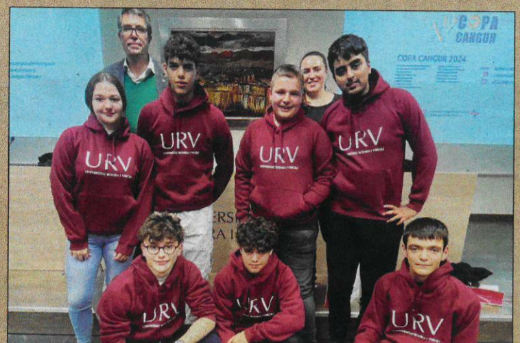
Equip guanyador de la categoria júnior de l'Institut de Tecnificació d'Amposta

Per al campus, acollir la competició és també una forma de fomentar