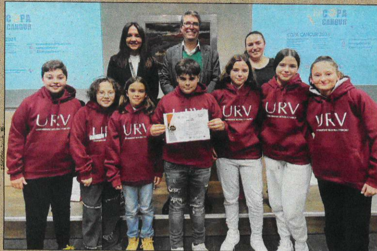
L'equip de l'Institut Roquetes, guanyador de la categoria cadet.

A la fase local de la Copa Cangur a Terres de l'Ebre hi han participat 203 alumnes d'ESO de quinze centres de secundària, concretament 105 de la categoria cadet i 98 de la júnior. Els participants, agrupats en equips de 7 estudiants, han hagut de resoldre 12 problemes matemà-