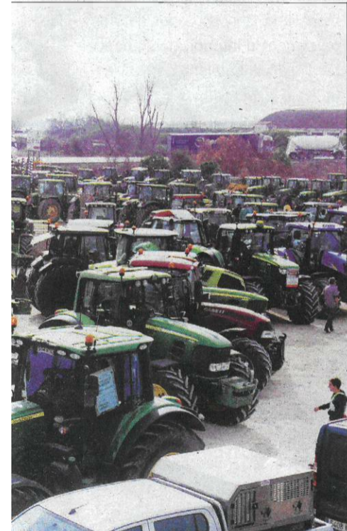
re de la Candela de l'Aldea abans de tallar