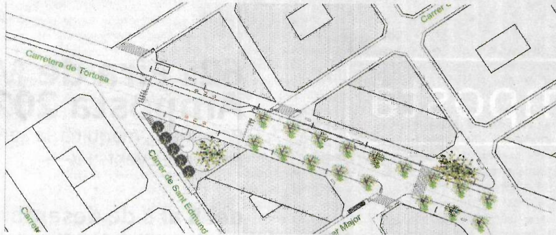
Un dels projectes més destacats per a l'any 2025 és la urbanització de l'accés a l'àrea comercial i la connexió amb el Raval de Sant Ramon.