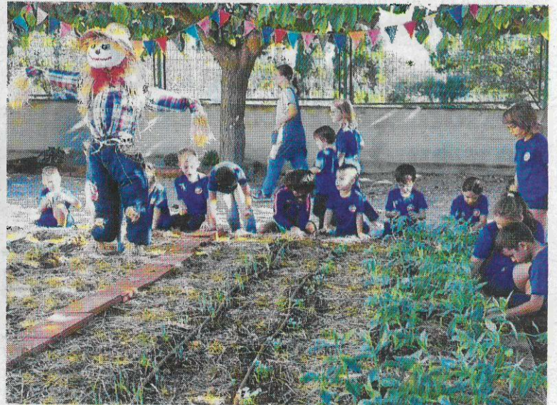
El projecte ha sigut reconegut amb un premi del Departament.

Alguns dels alumnes d'infantil i primària del centre 21 d'Abril de l'Aldea han passat una estona retirant herbes, traslladant insectes a un petit hotel que han fet de fusta, o llegint contes sobre la verdura entorn del seu hort ecològic. L'horta ocupa un destacat racó del pati de l'escola, i al mig un espantaocells vigila i protegeix les verdures que han plantat els infants. Hi cultiven carxofes, api, remolatxa, naps i altres verdures.