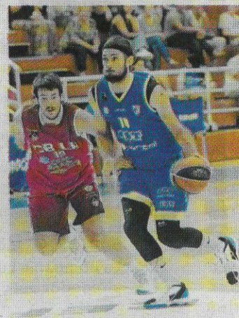
Alaminós en la pista del Serrallo.

El CBT recibe la visita en el Pavelló del Serrallo del Mataró a las 19.00 horas tras sumar el primer triunfo del curso la semana pasada en su visita al Palmar Basket Mallorca. Una victoria que los tarraconenses quieren que sea un punto de inflexión en toda regla. El curso