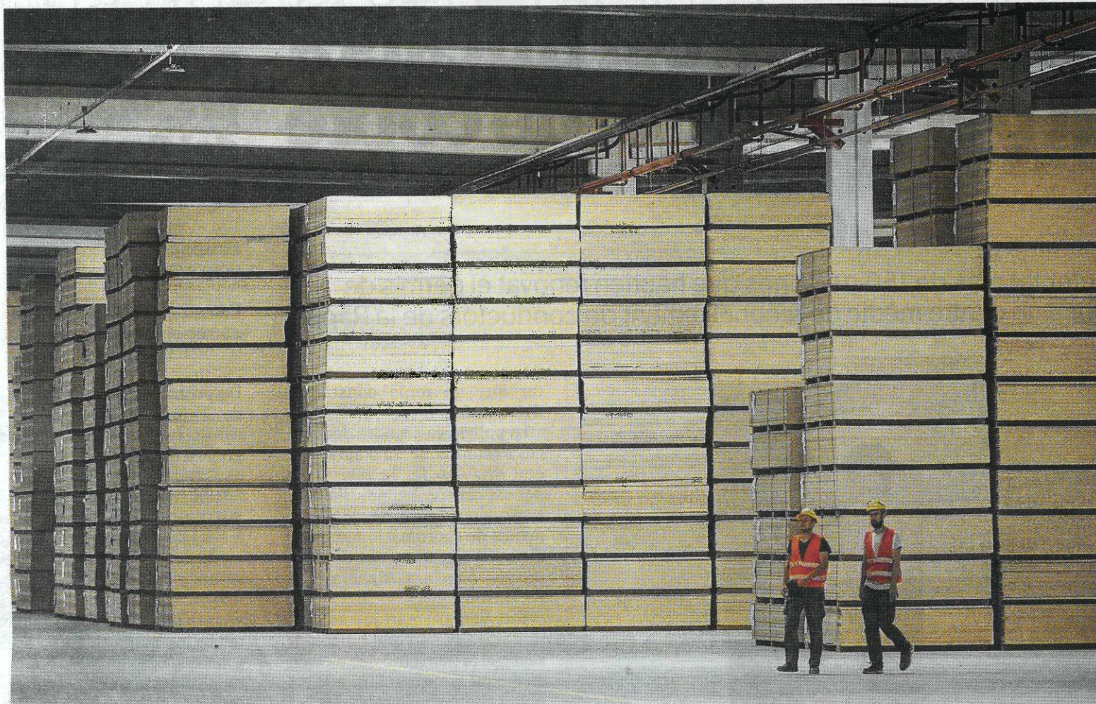
La fàbrica ja està en funcionament amb la línia de producció de taulers d'aglomerat amb fusta reciclada.