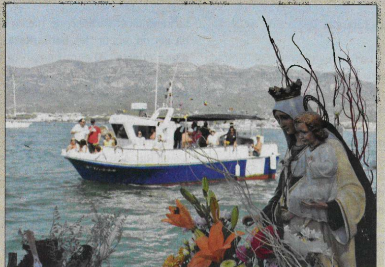
Imatges de l'any passat de la processó marítima de l'Ampolla, a l'esquerra, i de la Ràpita, a la dreta.

actes taurins amb la ramaderia Eliseo Adell; d'altra banda, a les 19 h, a la plaça González Isla hi haurà la festa infantil amb els espectacles de màgia Struc. A la nit, tornarà a haver-hi hit de ball, al port pesquer, a càrrec de l'orquestra Límite i, ben entrada la matinada, l'Associació Cultural Lo Rall continuarà amb la 'Festa Ball i Rall' amb el discjòquei Lluís Torralbo.