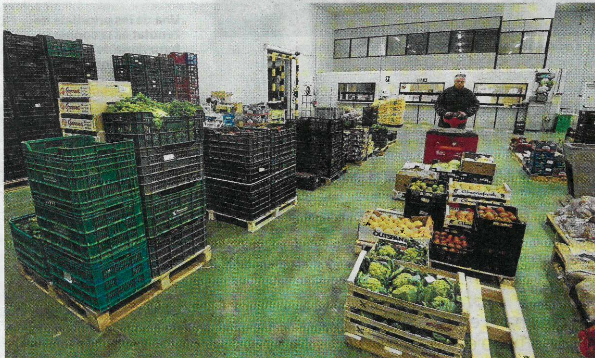
Instal·lacions de la Cooperativa de l'Aldea, centrada en la producció de verdures.

Dolcet lamenta que dotze anys després de la fallida encara no hi hagi data per al judici que ha de depurar responsabilitats i que s'ha de celebrar a l'Audiència