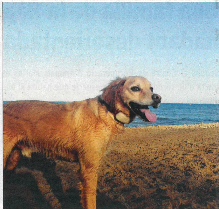
Coby jugant a la platja habilitada per a gossos, a la Ràpita.

D'altra banda, el municipi de les Cases d'Alcanar disposa des del 2013 de La Platjola, l'única platja de la costa canareva apta per a gossos, formada per còdols i grava, amb una extensió de 300 metres aproximadament, i que per la seua morfologia