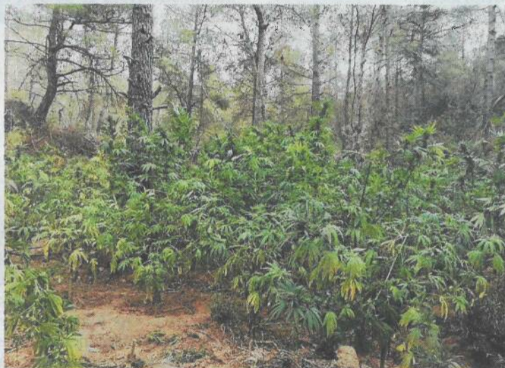
Plantació desmantellada a Arnes.

Paral·lelament, agents de la comissaria de Móra d'Ebre van anar a una plantació en un terreny rural, a prop d'una bassa de bombers, per desmantellar una altra plantació. En aquest cas, la majoria de plantes estaven recol·lectades i només en quedaven 50. Havia una caseta amb estris i menjar, però cap persona.