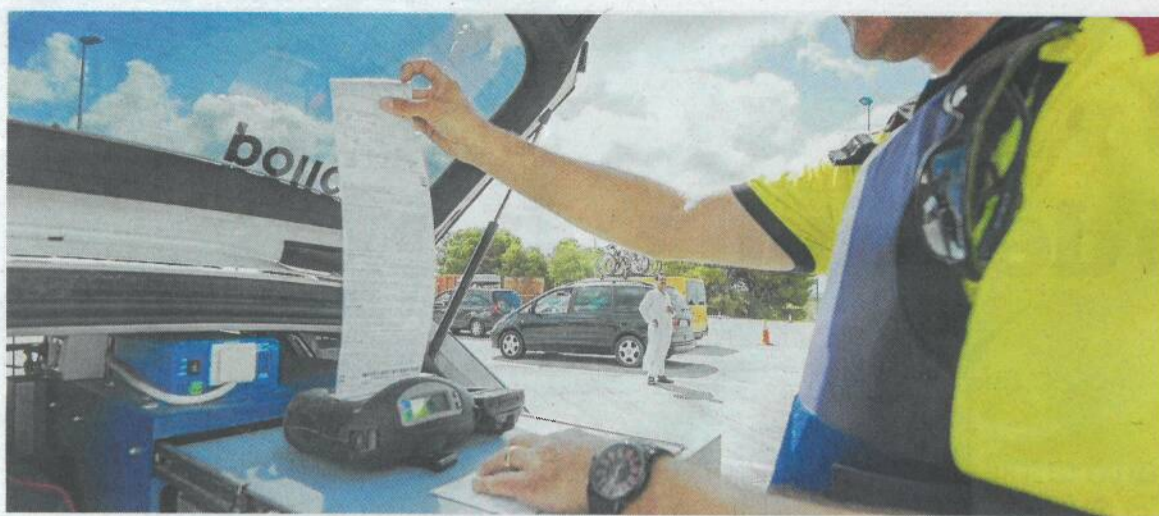
Un control dels Mossos d'Esquadra a les Terres de l'Ebre.