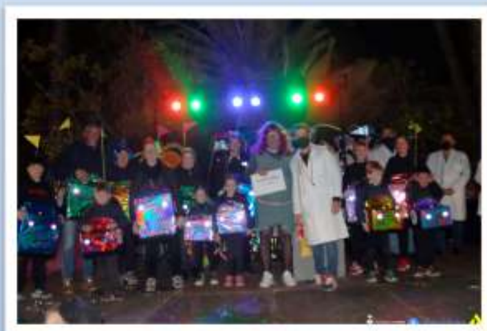
2n Premi - Autos de Xoc