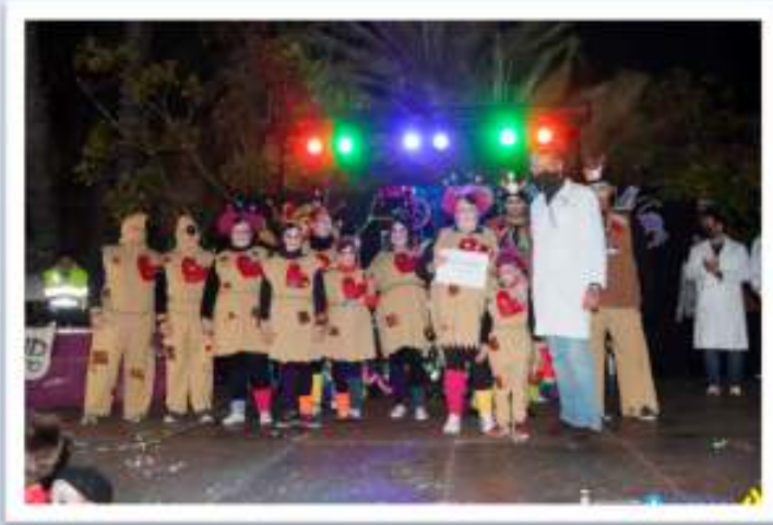
1r Premi - Pinxitos