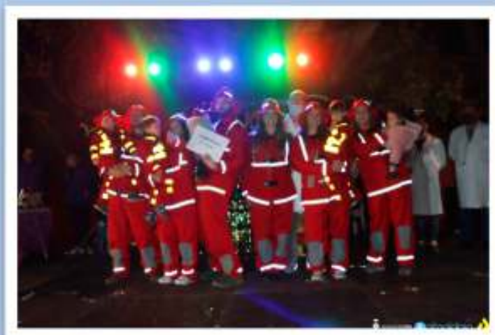
3r Premi - Els Petits Bombers