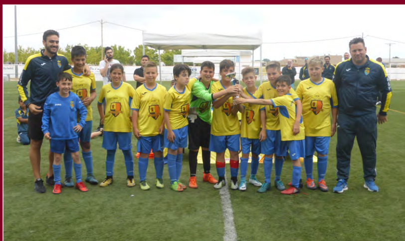
Subcampió UE ALDEANA