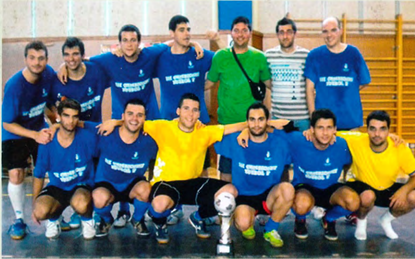
Campió: Trozo United (Salou)

Un èxit més del CFSF l'Aldea Restaurant Ullals per la gran l'organització amb el segon marató de futbol sala. Enguany l'equip de Salou amb el nom de TROZO UNITED va quedar campió de la II MARATÓ D'ESTIU DE FUTBOL SALA DE L'ALDEA en vèncer en la final a l'equip ampostí d'Aritosa per 3-2. Autoescola Montesó de Tortosa va quedar en tercer lloc.