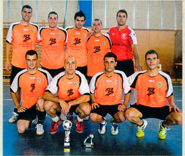
Subcampió: Aritosa (Amposta)

Un èxit més del CFSF l'Aldea Restaurant Ullals per la gran l'organització amb el segon marató de futbol sala. Enguany l'equip de Salou amb el nom de TROZO UNITED va quedar campió de la II MARATÓ D'ESTIU DE FUTBOL SALA DE L'ALDEA en vèncer en la final a l'equip ampostí d'Aritosa per 3-2. Autoescola Montesó de Tortosa va quedar en tercer lloc.