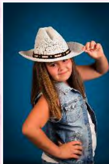
Cinta March Fort The Sherifes del Country