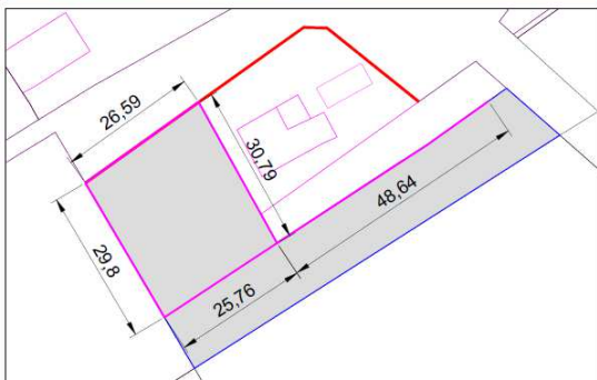
Plànol cadastral